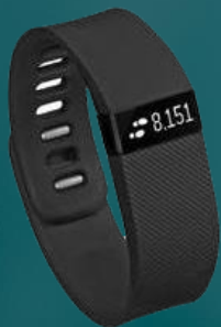
Objets intelligents et connectés